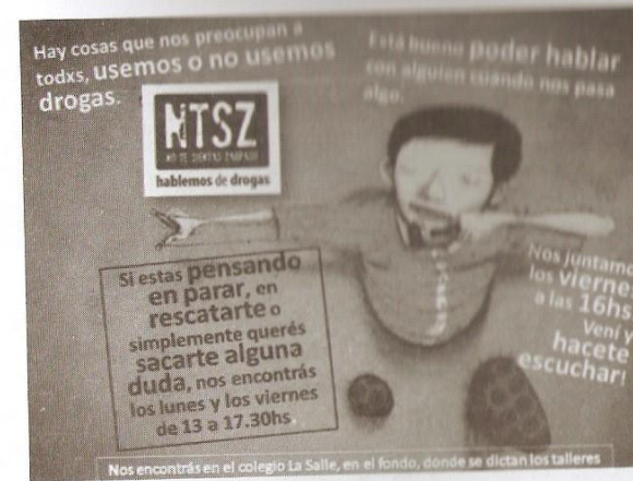
Material de difusión sobre actividades del dispositivo, 2013

“Entre las explicaciones más frecuentes se encuentra la vinculación entre jóvenes, delitos y drogas, de manera que “si un pibe roba, es porque usa drogas. Si un pibe roba, hay que cuidarse de todos porque son peligrosos” (...). La criminalización de los jóvenes que usan drogas produce mayor exclusión social” (fragmento del artículo “Ni chorros, ni adictos, ni adictos, sólo pibes.” en la Revista Reveldía Adolescentes, N°1 Año 1).